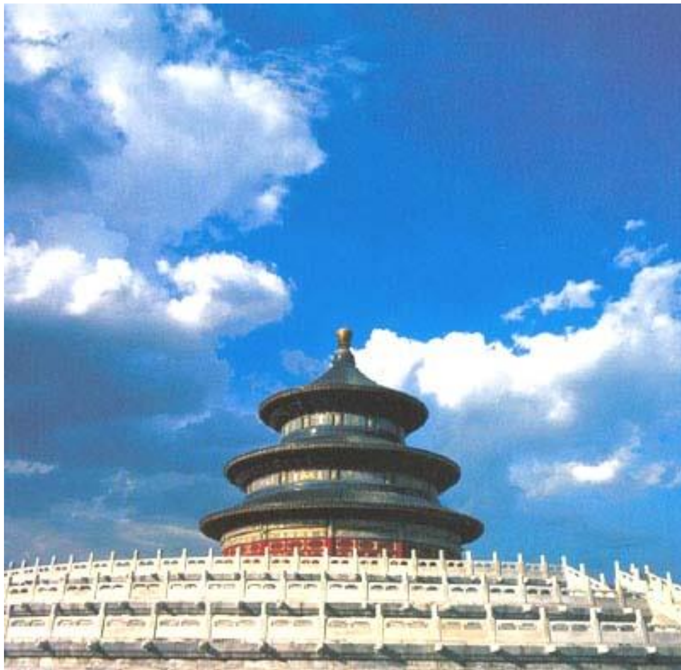
Debesu altāris 天坛 tiantan