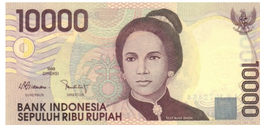
Banknote ar Čut Ņa Dienas portretu (6)