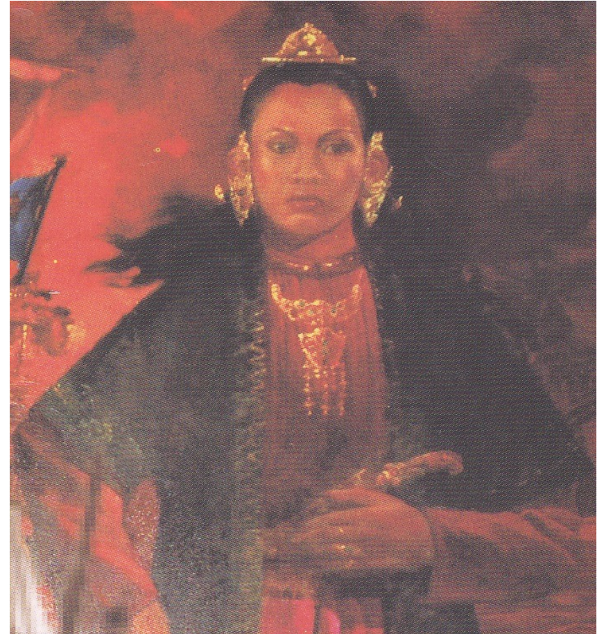
Ratu Kalinjamatas portrets, mūsdienu glezna. (1)