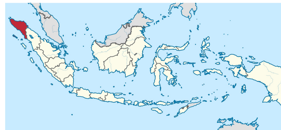
Lampadangas teritorija kartē (7)