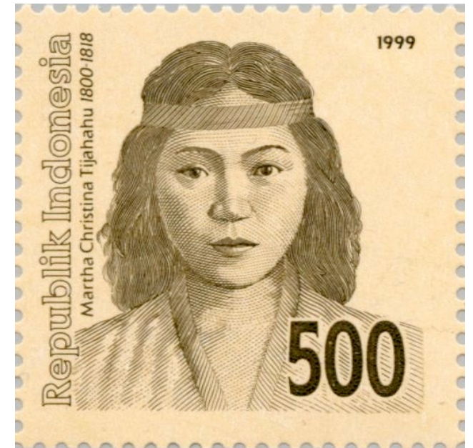
1999. gada Indonēzijas pastmarka ar Martas Kristinas Tihahu portretu (3)