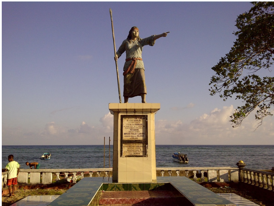
Martas Kristinas Tihahu piemineklis Abubu pilsētā (4)