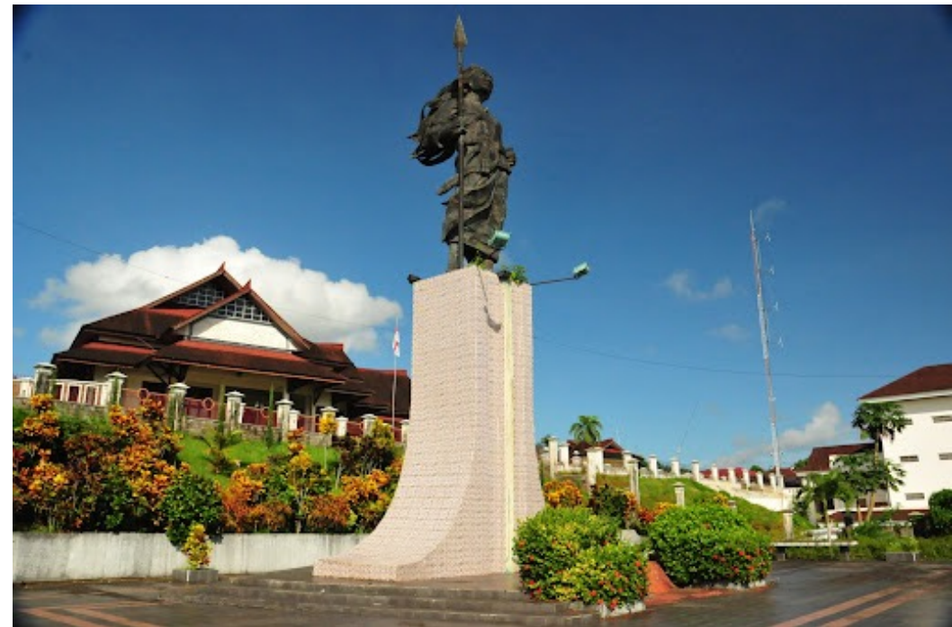
Martas Kristinas Tihahu piemineklis piemineklis Ambonas pilsētā (5)