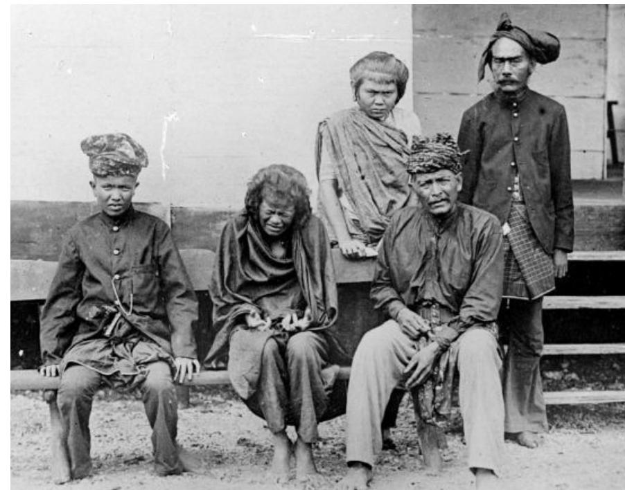
Čut Ņa Diena sagūstījumā (vidū) kopā ar pārējiem pretkustības dalībniekiem (1905) (8)