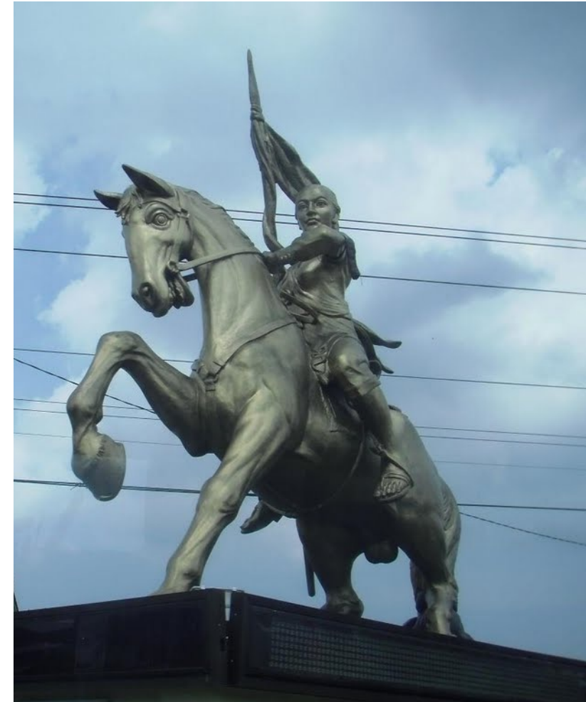
Ņi Agengas Serangas piemineklis Jogjakartā (2)