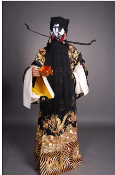
«Man» ir tiesas apģēbs