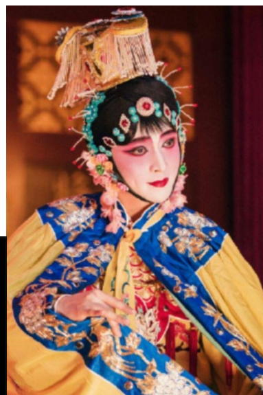
Daņ 旦 (galvenā sievietes loma)