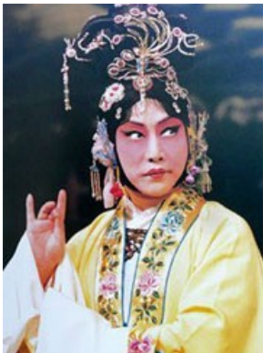
Zhang Junqiu 張君秋 (1920-1997)