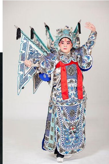
«Kao» karotāja apģērbs