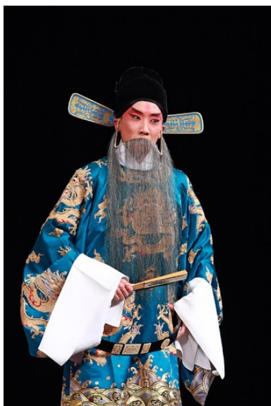
Šen 生 (galvenā vīrieša loma)