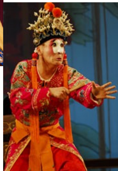
Čou 丑 (komēdiķis/klauns)