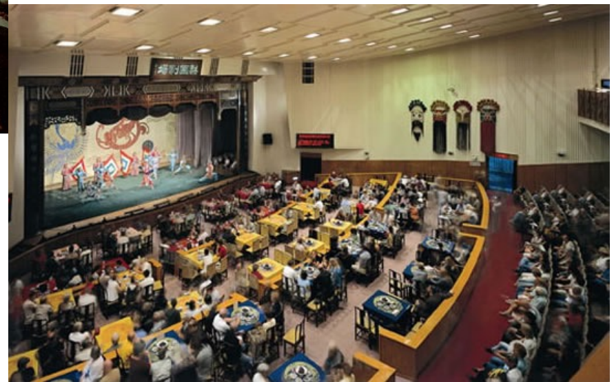
Lijuāņ teātris Pekinā