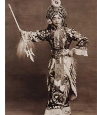
Cheng Yanqiu 程砚秋 (1904 - 1958)