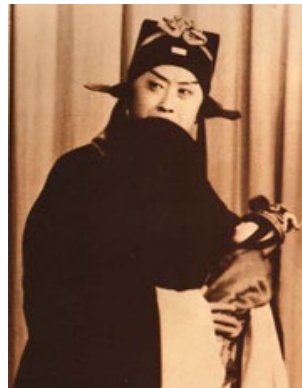
Ma Lianliang 马连良 (1901 - 1966)