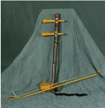
Divstīgu vijole HU