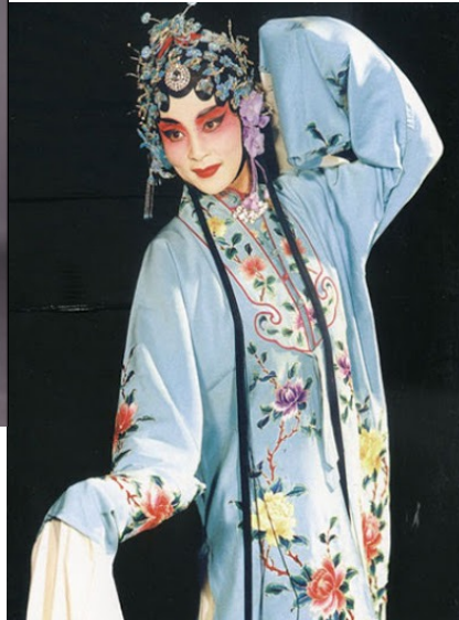
«Pei» ir augstākās klases ikdienas apģērbs