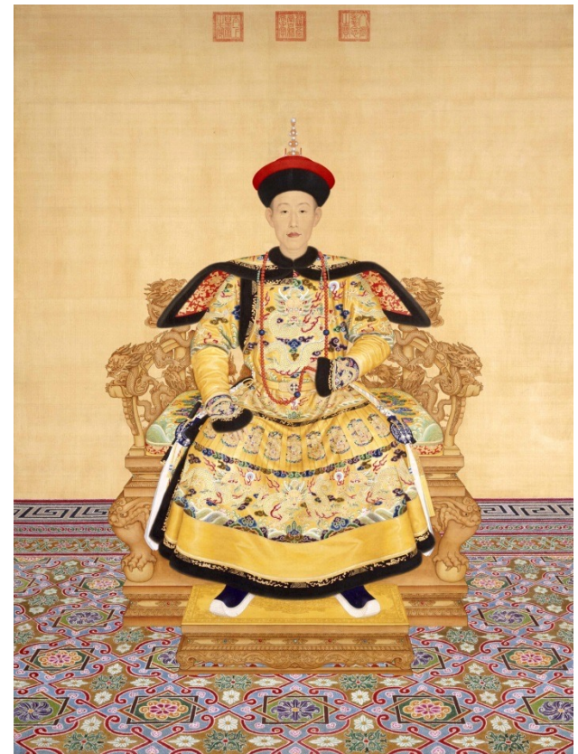
Imerators Cjanlun (乾隆帝)