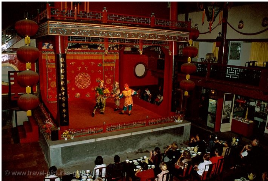
Dženjicji teātris Pekinā