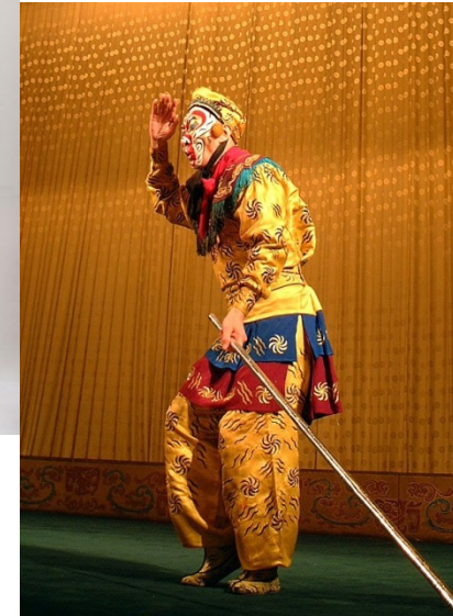
«Džedzi» vidusšķiras ikdienas apģērbs